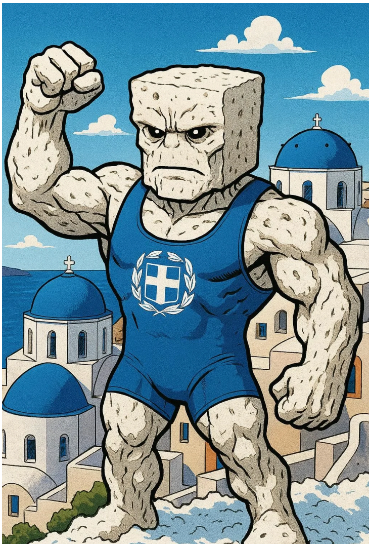
SUPERHÉROE DE GRECIA FETALÍMPICO