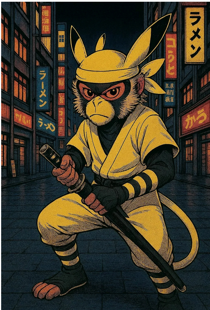
SUPER-HERÓI DE JAPÃO MACACOTSU