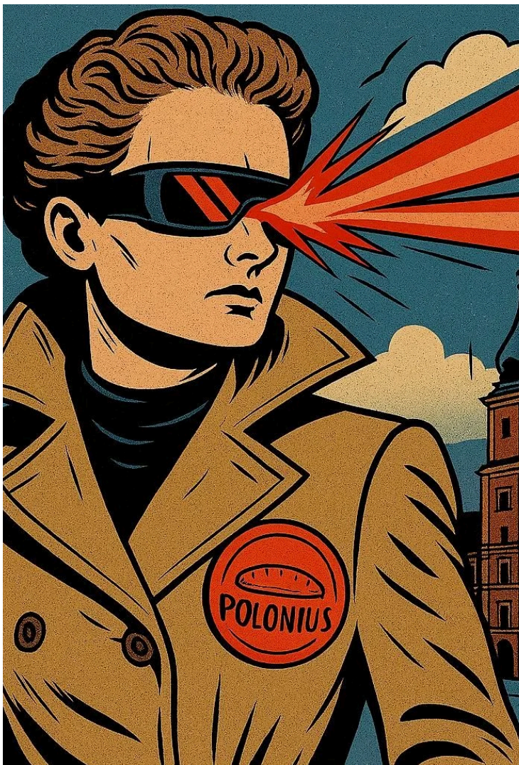
SUPER-HERÓI DE POLÓNIA MADAME PIEROGI