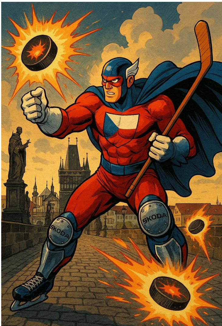
SUPER-HERÓI DE REPÚBLICA TCHECA DISCO EXPLOSIVO