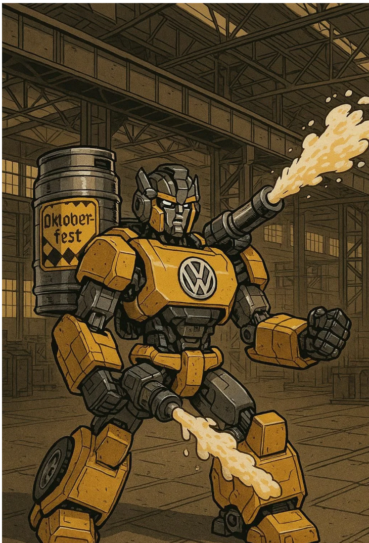
SUPERHÉROE DE ALEMANIA CERBEE