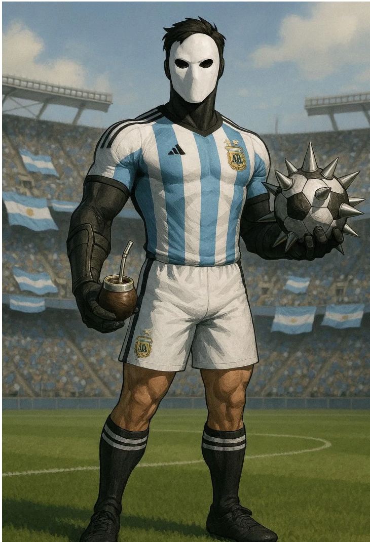
SUPERHÉROE DE ARGENTINA BALÓN ASESINO