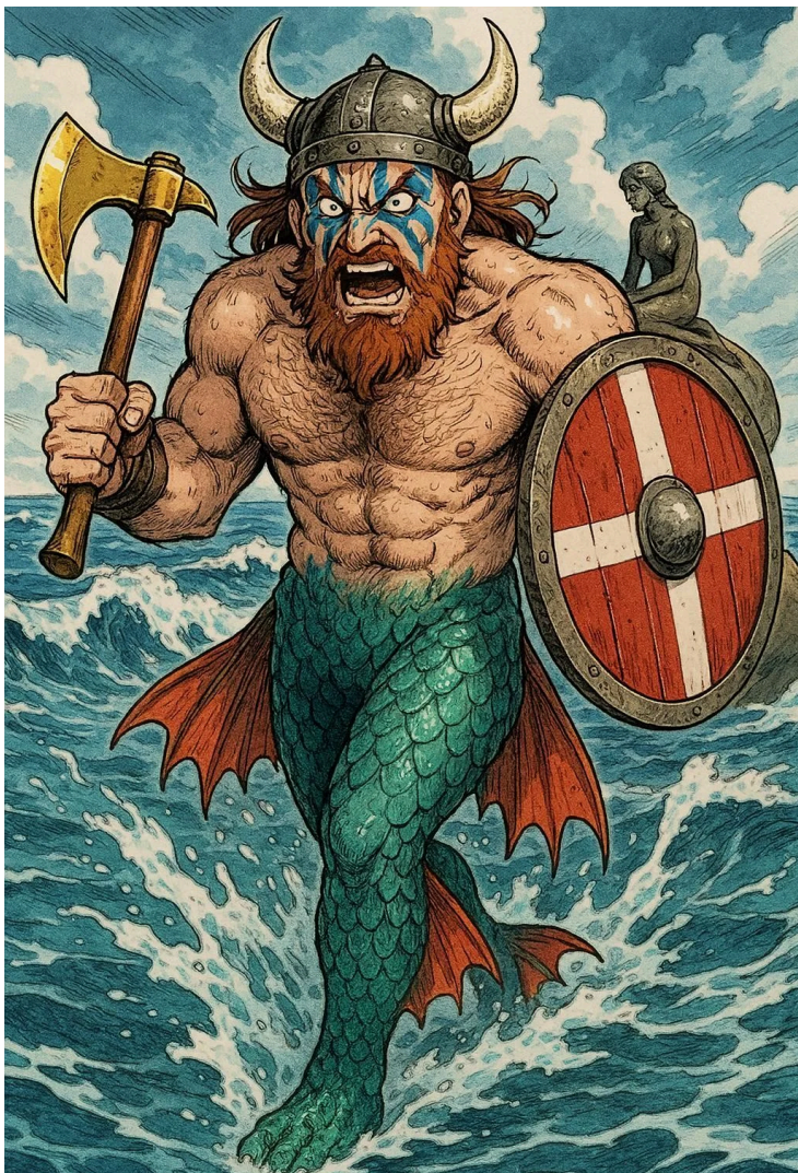
SUPER-HERÓI DE DINAMARCA VINKOR