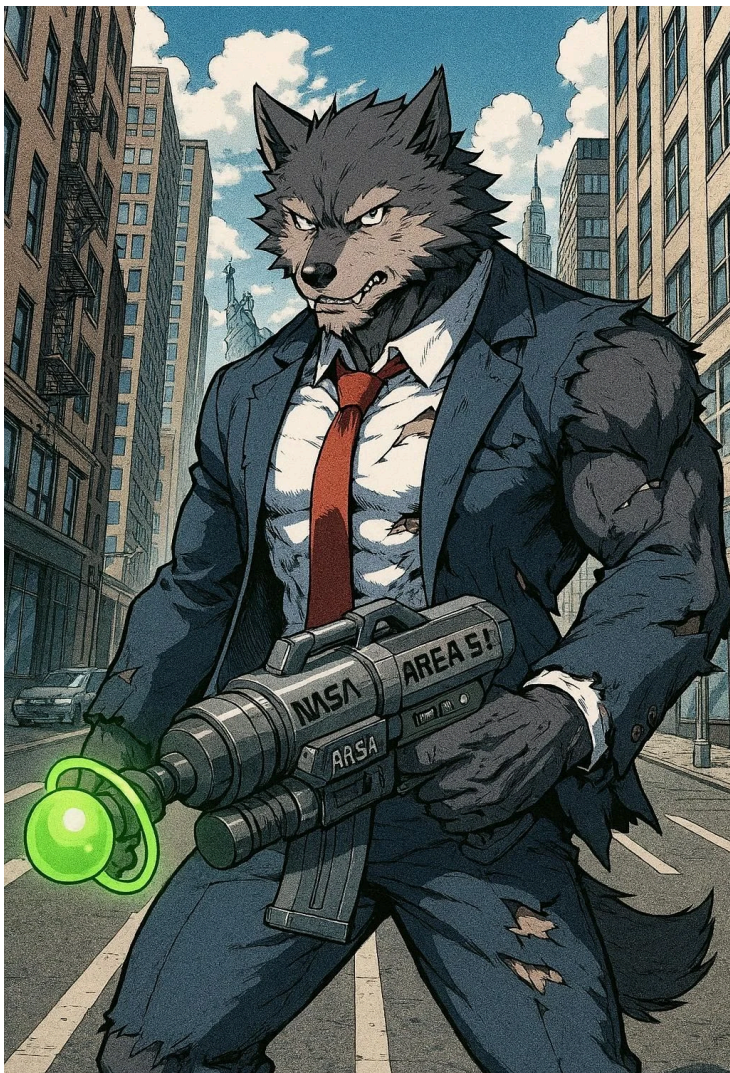
SUPER-HERÓI DE ESTADOS UNIDOS LOBO DE W.S.