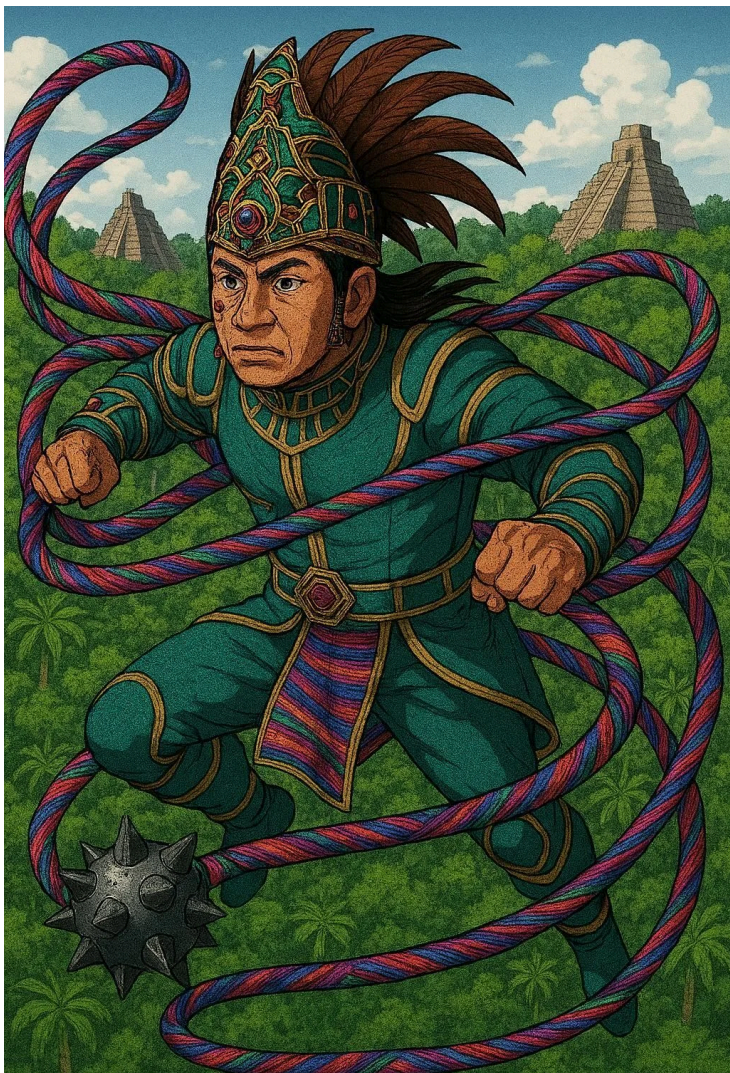
SUPERHÉROE DE GUATEMALA PEDRO MAYA