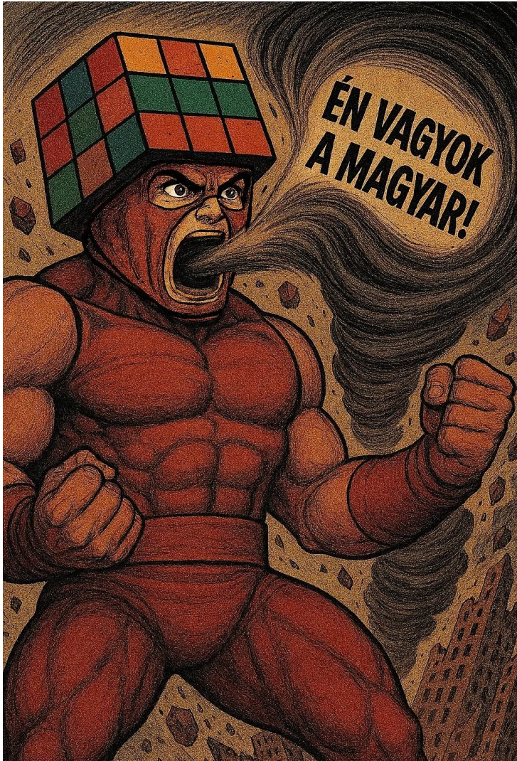
SUPERHÉROE DE HUNGRÍA MAGIK