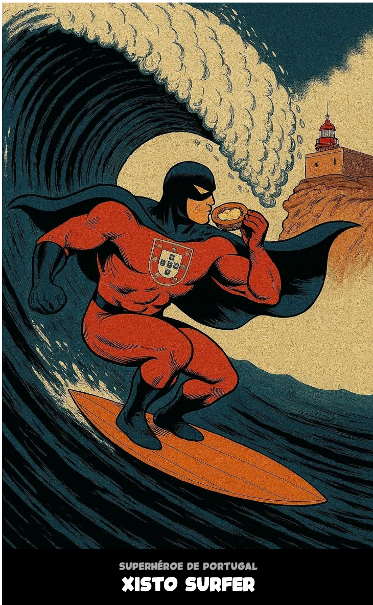
SUPERHÉROE DE PORTUGAL XISTO SURFER