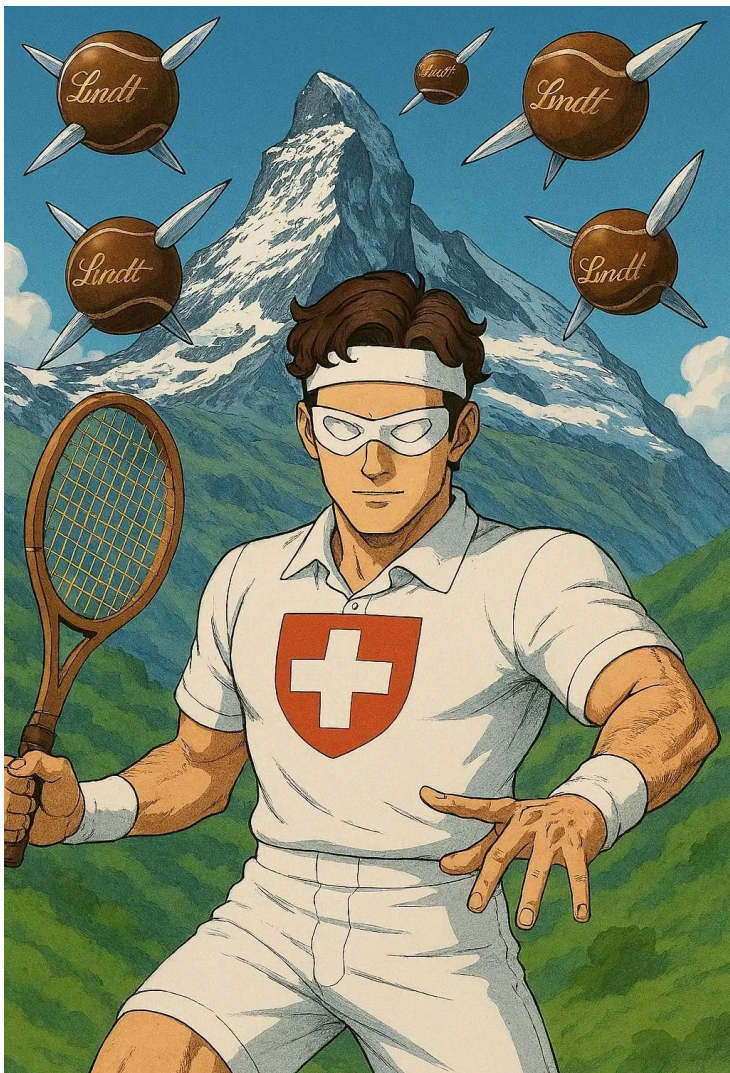
SUPERHÉROE DE SUIZA CHOCODER